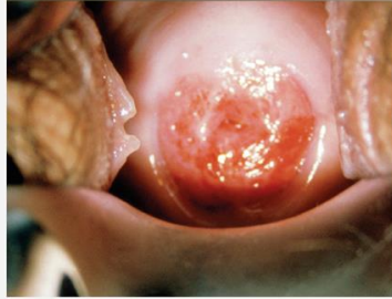
Infectado por HPV